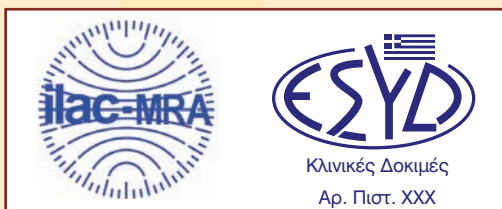
Σχήμα 2. Ο συνδυασμένος Εθνικός Λογότυπος του Ε.ΣΥ.Δ. και του ILAC

Επίσης, τα διαπιστευμένα εργαστήρια μπορούν να χρησιμοποιούν στα έγγραφά τους και τον λογότυπο του Ε.ΣΥ.Δ. σε συνδυασμό με τον λογότυπο του ILAC, προβάλλοντας έτσι τη διεθνή αναγνώριση των διαπιστευμένων δραστηριοτήτων τους.